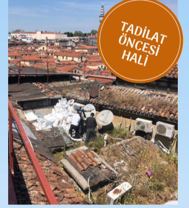
TADİLAT ÖNCESİ HALİ

civarında hafriyat gece gündüz demeden toplandı, çatı adeta