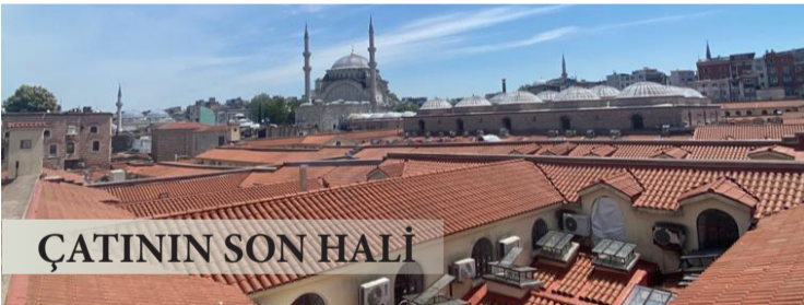
ÇATININ SON HALİ

görsellerini tek tek inceledi ve en eski kalem işi ve zemin renginin 1894 yılından önce yapılan kalem işi çalışması olduğunu tespit etti. Günümüzde hafızlarda yer alan ve 1980'lerde yapılan sarı zemin bordo kırmızı renklerdeki kalem işleri bu yüzden uygulanmadı. Çünkü eski görüntülerde tavanın zemin renginin kireç beyazı ve kalem işlerinin daha sade görünen yer yer sarmallarla bezeliydi. Yaklaşık 80'e yakın kalemkâr, günlerce çarşının sokaklarında kurulan iskelelerde ince bir işçilikle kalem işlerini uyguluyor. Tarihi Şark Kahvesi'nin önündeki Dua Meydanı'nda ise özel bir çalışma uygulanıyor. Burada uygulanan kalem işleri, gerçek altından yapılan bezemelerle donatılarak daha dikkat çekici bir görünüm veriliyor. Çalışmalarda sona doğru yaklaşıldı. Boya imalatının yüzde 77'si bitti. Kalem işleri de yüzde 75 oranında tamamlandı. 561 yıllık Kapalıçarşı, karşılaşılabilecek sorunlara karşı, daha dayanıklı, yapılan bakımlar sayesinde daha ihtişamlı bir görüntüyle yarınları kucaklayacak.