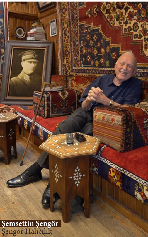
Şemsettin Şengör Şengör Halıcılık