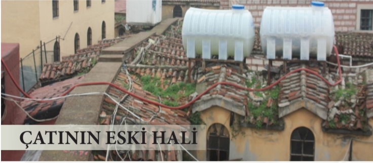
ÇATININ ESKİ HALİ

Dünyanın göz bebeği, milyonların uğrak noktası tarihi Kapalıçarşı, önemini ve varlığını kurulduğu ilk günkü gibi korumaktadır. Yediden yetmişe yerli yabancı herkes için büyük bir değer taşıyan bu eşsiz yapı geçmişte maalesef pek çok felakete karşılaştı. Ancak önemi ve değeri daima baki kaldı. Bu sayede yapı, dönemin şartlarına göre restore edildi, onarıldı ve ayakta durması sağlandı. Günümüzde de çarşının yeniden bir tadilata, onarılıp iyileştirilmeye ihtiyacı olduğu saptandı ve bunun üzerine çarşıda hummalı bir çalışma başladı.