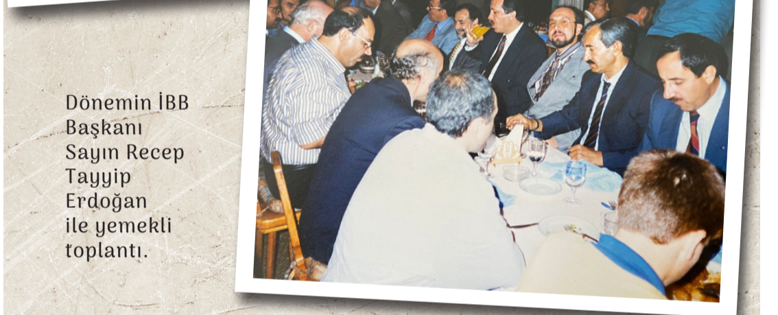
Dönemin İBB Başkanı Sayın Recep Tayyip Erdoğan ile yemekli toplantı.