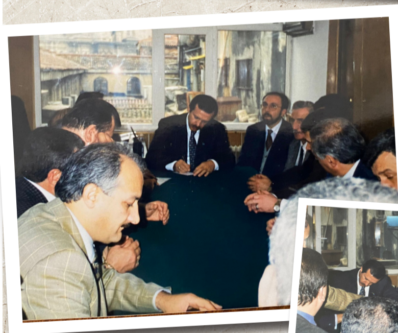
Dönemin İBB Başkanı Sayın Recep Tayyip Erdoğan'ın Kapalıçarşı Esnafı Derneği Yönetim Kurulu defterini imzalarırken...