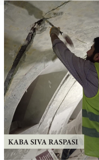
KABA SIVA RASPASI

tahrip olan noktalar belirlendi. Adeta yara içinde olan duvarlara enjeksiyon imalatı yapılarak sağlıklı hale getirildi. Enjeksiyon imalatı yüzde 90 oranında tamamlandı. Zeminde oluşmuş çökmelere karşı ise statik güçlendirme ile takviyeler yapılarak yapının temeli sağlamlaştırıldı. Toplamda 330 ton güçlendirme imalatı yapıldı.